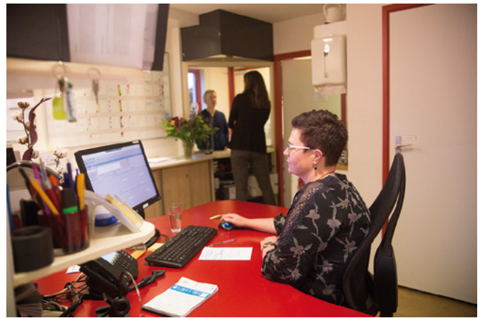
Tijd voor patiënten in Huisartsenpraktijk Afferden.