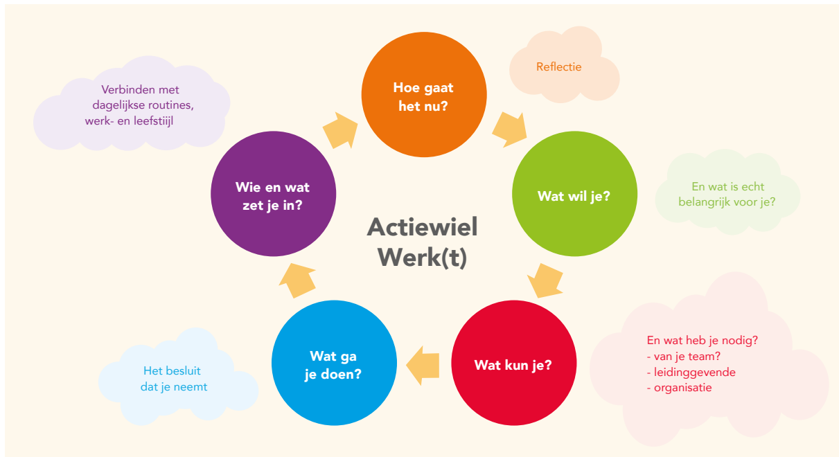
Afbeelding 2. Actiegerichte vragen binnen de teamgerichte benadering

Dit voorbeeld is ontwikkeld door Value2Share en Medicoach (2019) en gebaseerd op de iPH-basismodule Werken met Positieve Gezondheid.